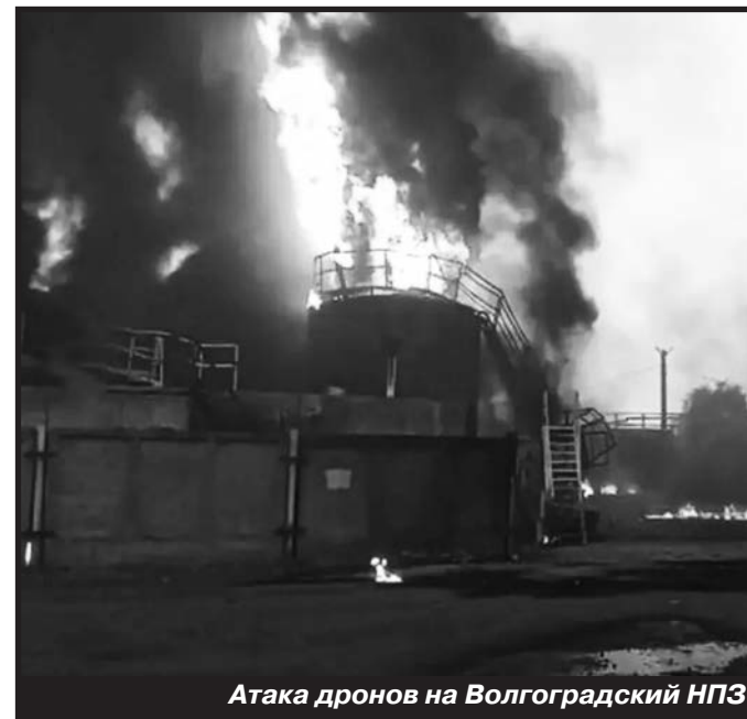
Атака дронов на Волгоградский НПЗ «Лукойла»

«Только при окончании военных действий правительству удастся сбалансировать бюджет. Бюджетный стимул 2022-2025 годов – это примерно 10% ВВП России, то есть это 2,5-3% ВВП в год. В сегодняшних деньгах это примерно 20 трлн рублей. Результатом этого бюджетного стимула стало увеличение не только оборонного заказа, но и зарплата по всей стране», – пишет в своей колонке в РБК бывший министр финансов России Михаил Задорнов.